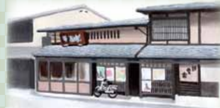
Pancarte sculptée en bois

Tessai Tomioka (1836~1924) Erudit confucéen et peintre Literati du temps des ères Meiji et Taisho.