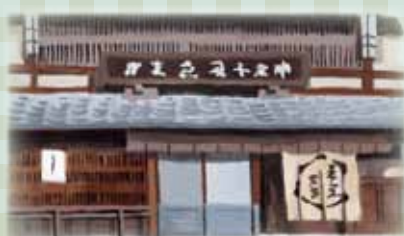
Pancarte sculptée en bois

Vieille confiserie de Kyoto dite « Kyogashi », fondée en 1840. Cette échoppe a déjà été exposée à Paris durant l'ère Meiji. On reconnaît cette échoppe à son signe en bois, une unique plaque de cyprès décorée de moules en bois caractéristiques des confiseries.