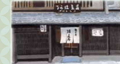
Pancarte sculptée en bois

Tenko Nishida (1872~1968) Politicien, pieux et travailleur social. Fondateur de Ittoen.