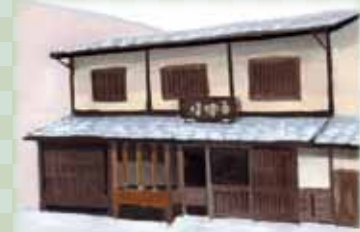
Pancarte sculptée en bois

Echoppe Miso fondée en 1708. Rosanjin Kitaoji, célèbre artiste et bon vivant, a peint et sculpté l'enseigne de cette échoppe. Le caractère « Yuzumiso », présent dans son symbole, représente le mieux son échoppe.