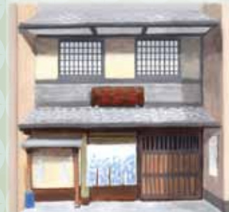
Seiho Takeuchi (1864~1942)

Echoppe de tapisserie dite « Hyogu » fondée en 1856. Hyogu consiste en une technique de tapisserie visant à combiner l'utilisation de papier et de vêtements pour préserver la qualité des peintures et calligraphies. Son symbole a été peint par Seiho Takeuchi, célèbre pour ses peintures japonaises.